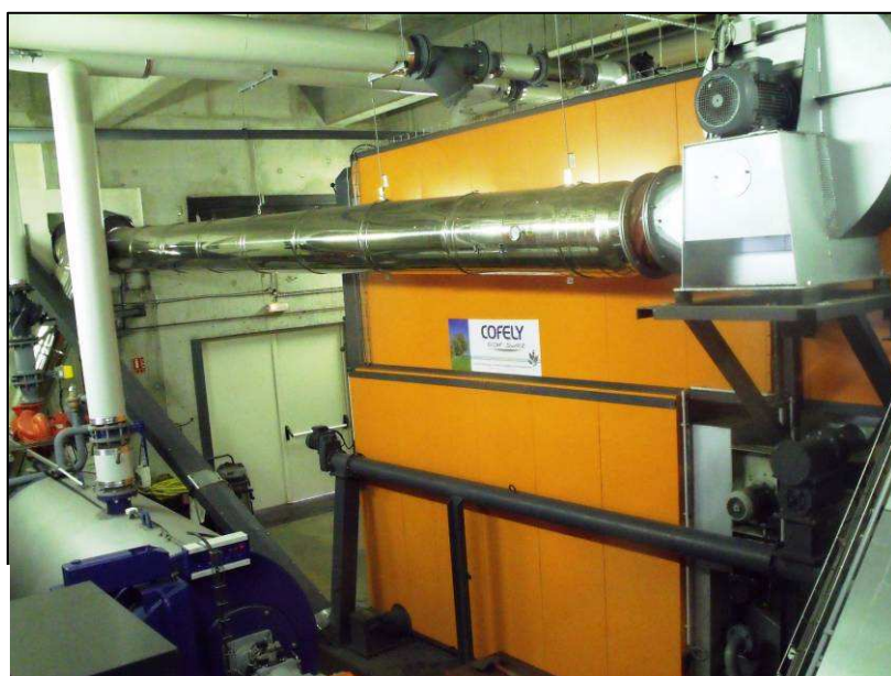
La chaudière, alimentée par les copaux de bois