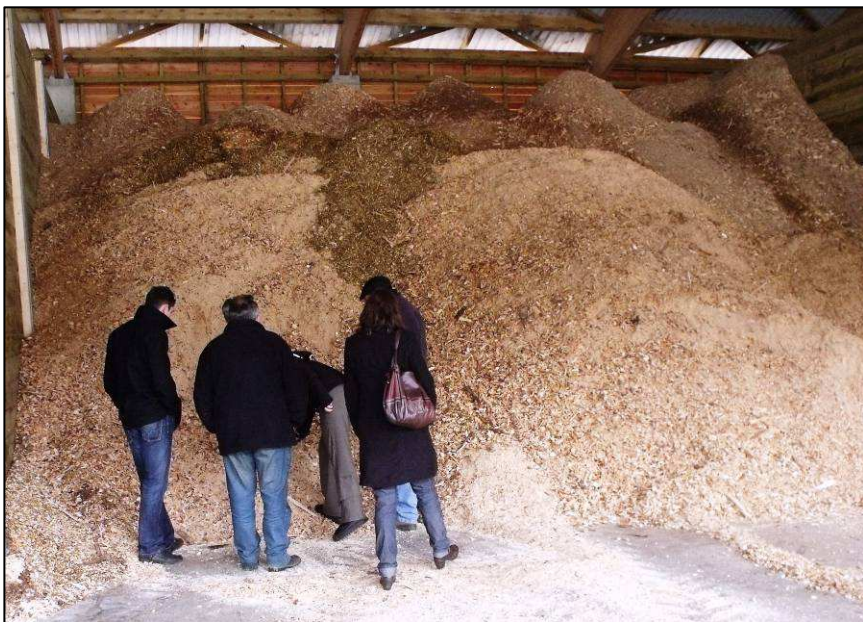
Le combustible produit et séché sur place