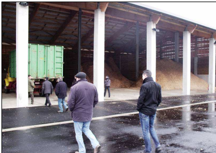
La plateforme de stockage et de séchage des produits connexes de scieries

Sur la zone d'activité de la commune de Murat, les financements obtenus grâce à la charte forestière ont permis à une scierie de s'installer dans des bâtiments neufs (une dizaine d'emplois). Elle produit des planches et des charpentés. Par ailleurs, la communauté de communes a investi dans un hangar qui sert de plateforme de stockage et de séchage pour les produits connexes de la scierie qui sont valorisés en combustibles. Plusieurs scieries l'utilisent. Ils ont également acheté un broyeur en commun pour produire du combustible sur place.