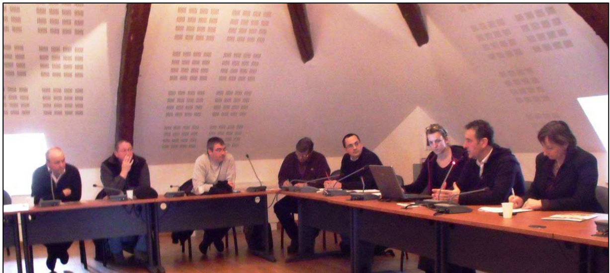
Les élus du Pays attentifs aux propos du Président de la communauté de communes du Pays de Murat (à droite)

Chacune de ses actions est portée par un maître d'ouvrage différent (Communauté de communes, communes, entreprises, associations). La communauté de communes, qui anime la démarche de Charte Forestière, a souhaité développer au maximum les partenariats public/privé : la collectivité investit par exemple dans l'achat d'un terrain et d'un bâtiment, puis un privé investit dans l'aménagement du bâtiment pour en faire un lieu touristique (hôtellerie et restauration). Un contrat type « bail emphytéotique » les lie pour sécuriser les porteurs de projets dans la durée. Un contrat de confiance très important doit s'établir entre la collectivité et les porteurs de projets pour mener à bien ce type de démarche.