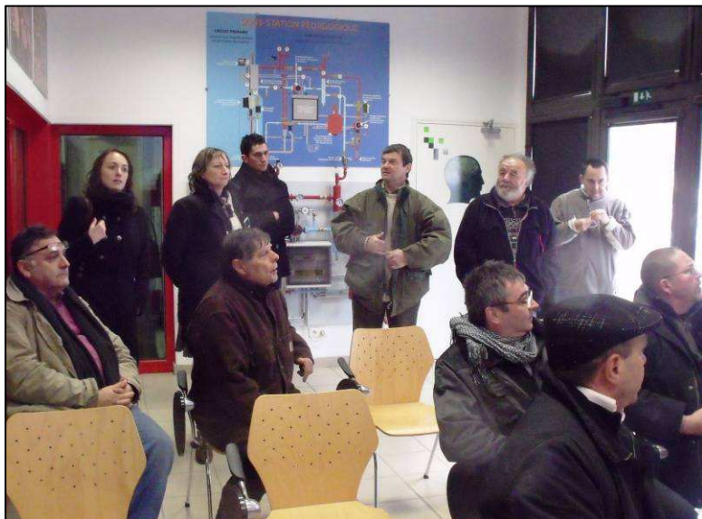
Dans la salle pédagogique