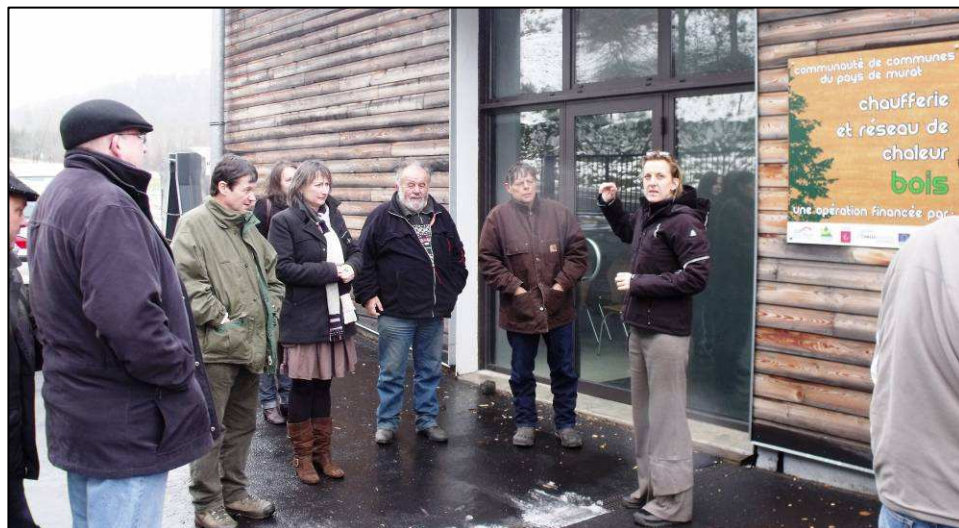
Devant la chaufferie

L'aménagement d'un espace pédagogique au cœur de la chaufferie apporte à cette réalisation une dimension innovante. Scolaires, professionnels et visiteurs accueillis dans cet espace équipé d'une baie vitrée et d'outils multimédia, peuvent ainsi découvrir de manière ludique les installations, les étapes clés de la filière bois et le fonctionnement du réseau.