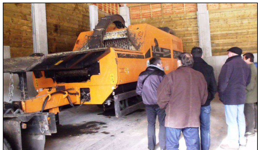
Le broyeur, acheté entre plusieurs scieries

Sur la zone d'activité de la commune de Murat, les financements obtenus grâce à la charte forestière ont permis à une scierie de s'installer dans des bâtiments neufs (une dizaine d'emplois). Elle produit des planches et des charpentés. Par ailleurs, la communauté de communes a investi dans un hangar qui sert de plateforme de stockage et de séchage pour les produits connexes de la scierie qui sont valorisés en combustibles. Plusieurs scieries l'utilisent. Ils ont également acheté un broyeur en commun pour produire du combustible sur place.